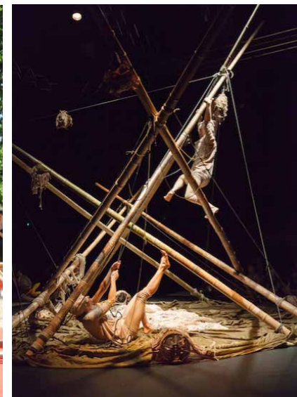
SOL DE NOCHE, 2015