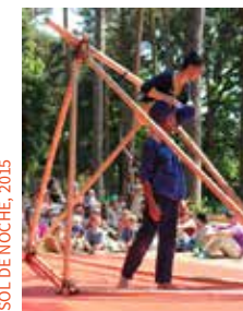
SOL DE NOCHE, 2015