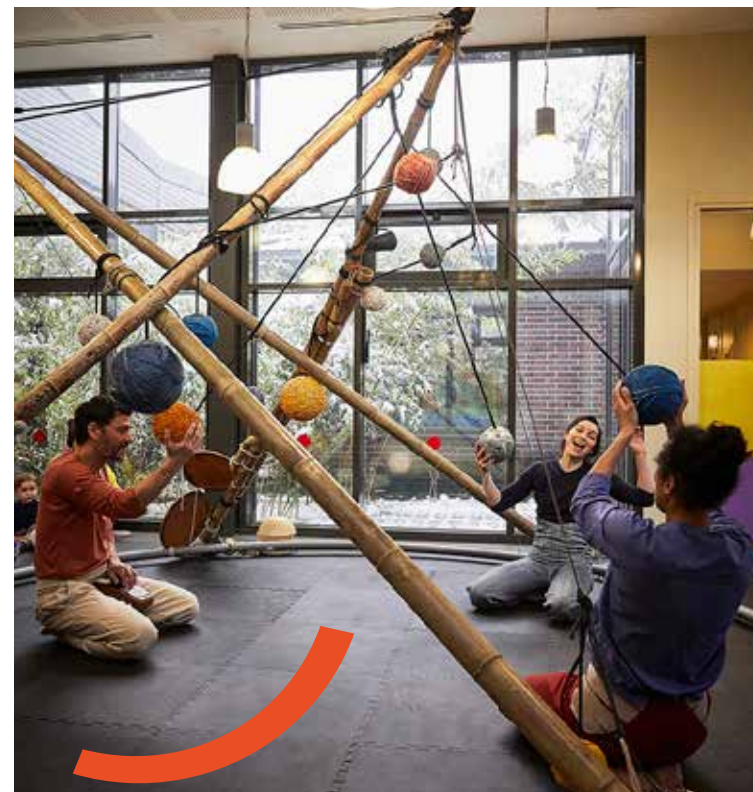
TEMPS DU SPECTACLE

Twinkle s'articule en deux temps complémentaires et indissociables . Le public, rassemblé en cercle autour d'une structure aérienne en bambous est tout d'abord spectateur , se laissant bercer et imprégner par les sons et mouvements d'une chanteuse, d'une acrobate aérienne et d'un musicien percussionniste.